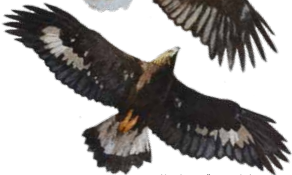
Ung kungsörn med vit teckning, de äldre är helt bruna.