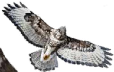
Ormvråk – tas ofta för örn, men är mycket mindre.