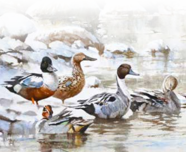
Fr.v: Skedand (hane och hona), stjærtand (hane), snatterand (hane). Längst fram: kricka (hane).