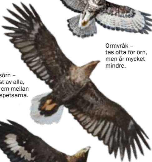
Havsörn – störst av alla, 240 cm mellan vingspetsarna.